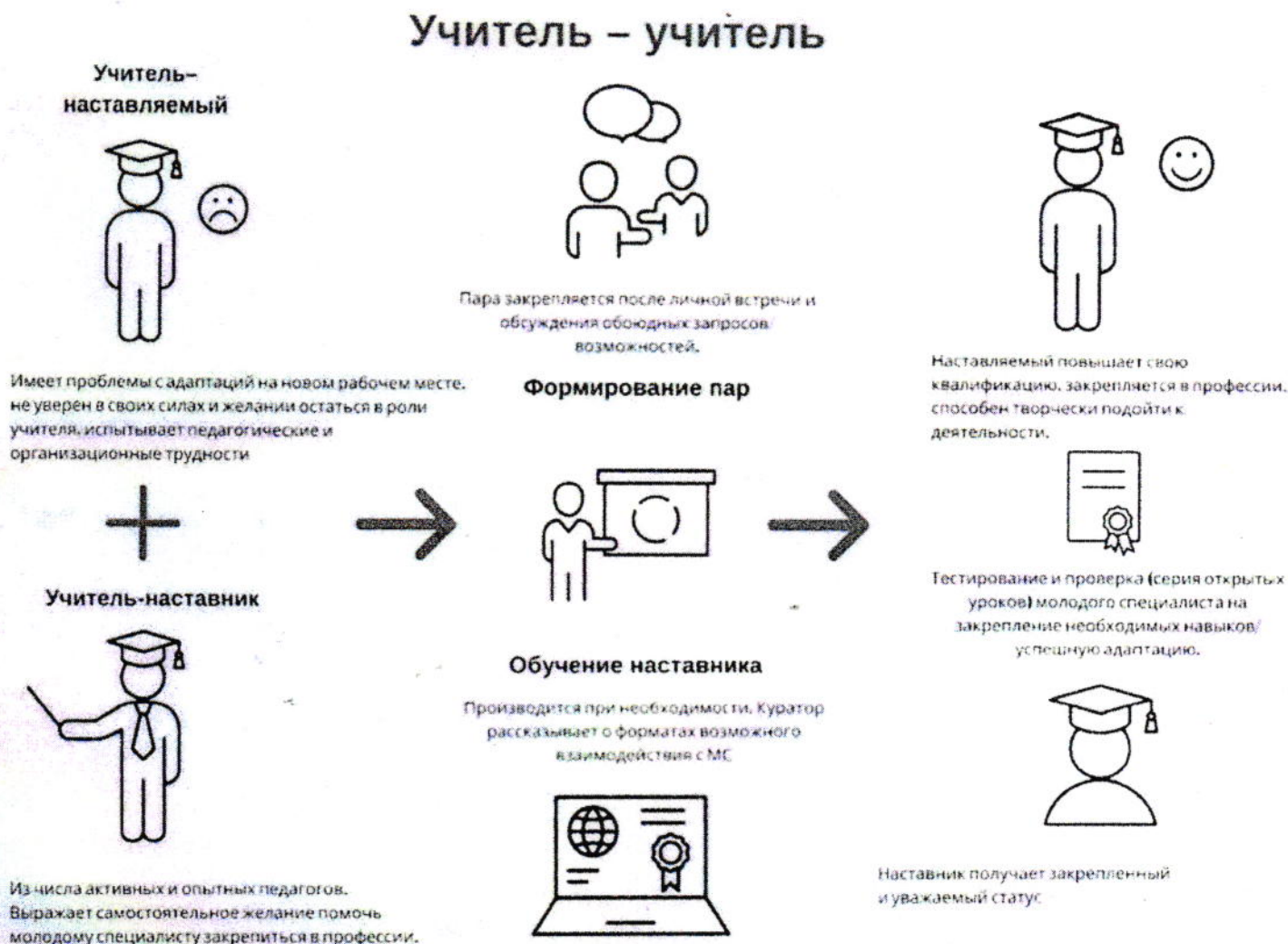
Рис.1 Графическое представление реализации программы наставничества

Куратором программы наставничества является руководитель кафедры учителей начальных классов.